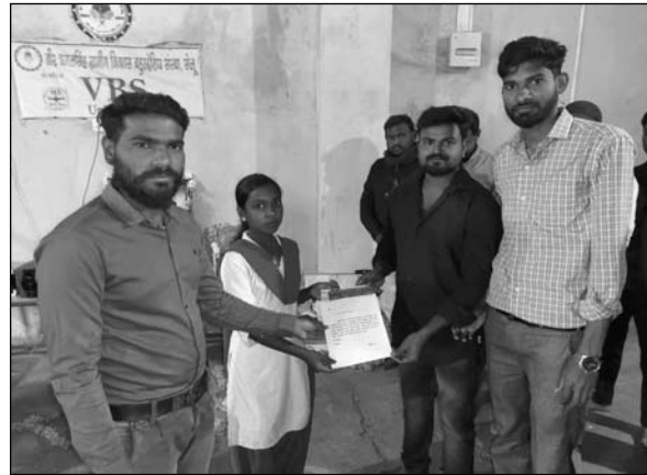
विद्यार्थ्यांना शैक्षणिक मदत देताना वीर भगतसिंह संस्थेचे पदाधिकारी छत्रपती शिवाजी महाराजांना मानवंदना देण्यात आली. वीर

शिवाजयंतीनिमित्त व्हीबीएस युनिटी जिममध्ये एका कार्यक्रमाचे आयोजन करण्यात आले होते. सर्वप्रथम