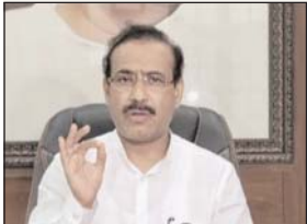
वृत्तसंस्था / १७ जानेवारी नवी दिल्ली : कालपासून देशभरात कोरोना लसीकरणाला सुरुवात झाली आहे. सर्व राज्यांमध्ये सुरुवातीला आरोग्य कर्मचाऱ्यांना ही लस दिली जात आहे. दरम्यान, सर्वसामान्य नागरिकांना लस मोफत द्यावी, अशी मागणी महाराष्ट्राचे आरोग्य मंत्री राजेश टोपे यांनी केंद्र सरकारकडे केली आहे. उस्मानाबाद जिल्ह्यातील कळंब येथील एका हॉस्पिटलचे उद्घाटन आरोग्य मंत्री राजेश टोपे यांच्या हस्ते पार पडले. यावेळी पत्रकारांशी ते बोलत होते.

सर्वसामान्य नागरिकांना कोरोनाची लस मोफत द्यावी आरोग्य मंत्र्यांची केंद्र सरकारकडे मागणी