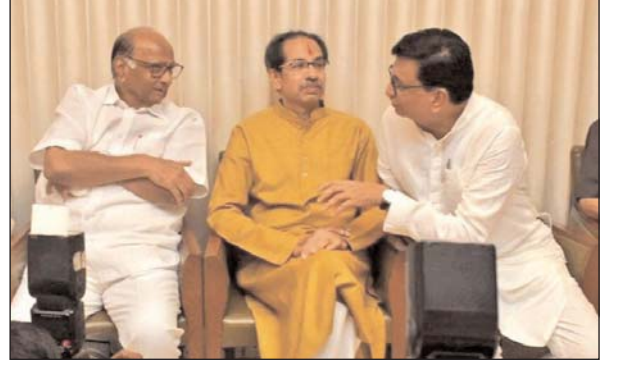
वृत्तसंस्था / १७ जानेवारी मुंबई : औरंगाबाद महापालिकेच्या निवडणुकीच्या तोंडावर औरंगाबाद शहराचं

नामांतर करण्याच्या हालचाली ठाकरे सरकारकडून सुरु झाल्या आहेत. यातच सीएमओ म्हणजे मुख्यमंत्री कार्यालयाच्या ऑफिशियल टिव्टर हॅन्डलवरून करण्यात आलेल्या टिव्टरमध्ये औरंगाबादचा उल्लेख संभाजीनगर असा करण्यात आला होता. त्यानंतर काँग्रेसनं विरोध दर्शवला होता. विरोधानंतरही शिवसेनेकडून नामांतराबाबत वक्तव्य केली गेली. यावर आता काँग्रेस नेते आणि मंत्री बाळासाहेब थोरात यांनी ट्वीट करत म्हणून एकदा नामांतराबाबत भूमिका स्पष्ट केली. नामांतराचे राजकारण कोणाला प्रिय? पाच वर्षे सत्तेत असलेलेच दोगीपणा करत आहेत, असं बाळासाहेब थोरात यांनी म्हटलंय. शिवसेना खासदार संजय राऊत यांनी आपलं सदर रोखठोकमधून थोरात यांनी ट्वीट करत उत्तर दिलं आहे. शहर असू नये. ही धर्मांधता नसून शिवभक्ती म्हणा, महाराष्ट्राचा स्वाभिमान म्हणा, नाहीतर इतिहासाचे भान; पण असा औरंगजेब कुणाला प्रिय असेल तर त्यांना कोपरापासून साष्टंगत दंडवत! हे वागणं सेक्युलर नव्हे! असं म्हणत संजय राऊत यांनी काँग्रेसला टोले लगावले होते. त्यानंतर बाळासाहेब थोरात यांनी ट्वीट करत उत्तर दिलं आहे. भूमिका स्पष्ट केल्यानंतर सल-